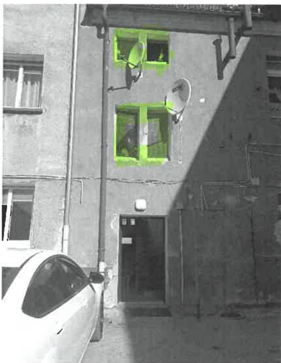
1) budynek główny nr 28