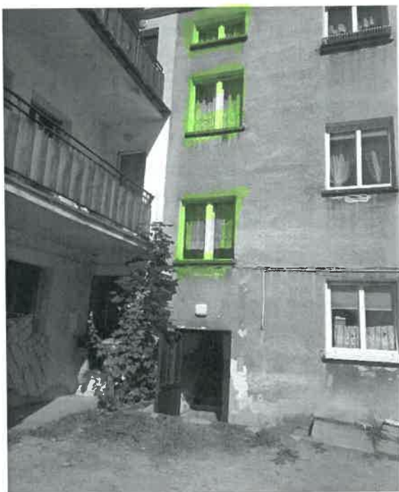
3)budynek główny nr 30